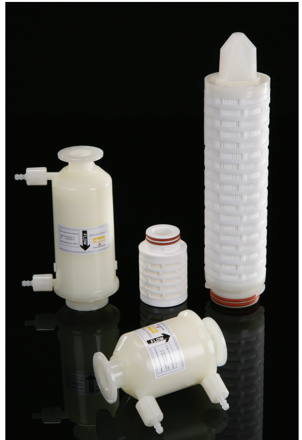
Примечание: BEVPOR является зарегистрированной торговой маркой Parker domnick hunter